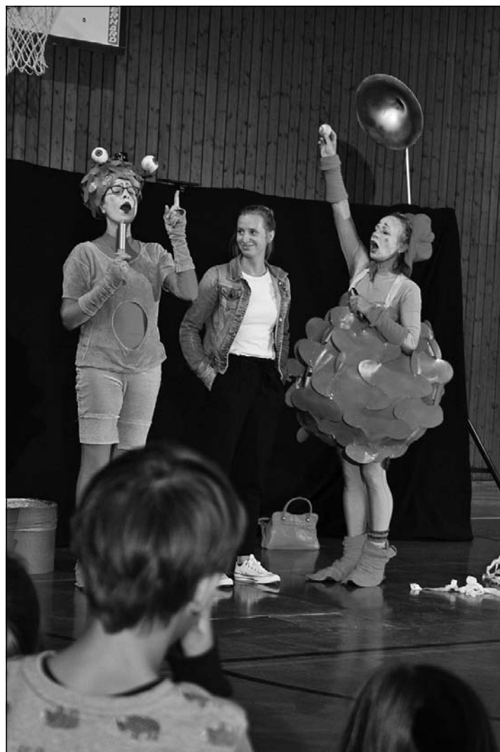
Rappeldu und Brummfidel wollen Tränenflüssigkeit gewinnen.

Die Grundschule Pettendorf-Pielenhofen bedankt sich beim THEATER MIT HAUT UND HAAREN (Kontakt@Theater-mit-Haut-und-Haaren.de) und beim LIONS CLUB CASTRA REGINA ganz herzlich für die gelungene Aufführung und für die Unterstützung.